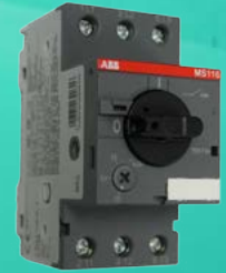
Disjoncteur magnéto-thermique Thermal magnetic circuit breaker