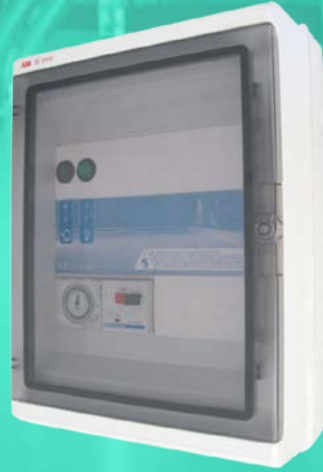
PA-310 PA-330 PA-370