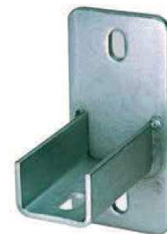
Platine U MPR, soudure longitudinale