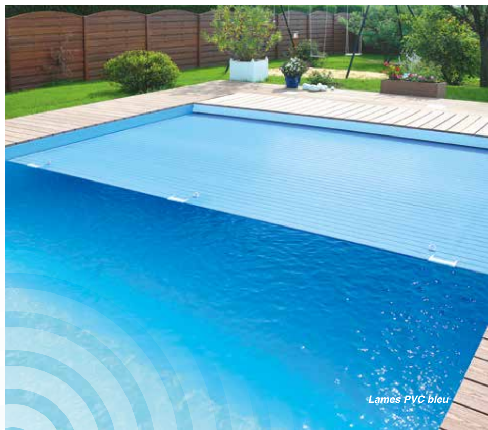
Lames PVC bleu